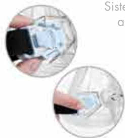
Sistema con fermaglio a sgancio rapido

Una cuffia ampia e resistente disperde i punti di pressione per un confort che va oltre la maschera stessa .