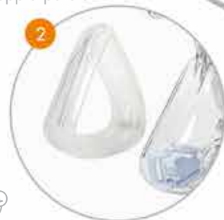
Cuscino a doppia parete

2 Un sistema a doppia parete in silicone con cuscini laterali ed una zona sagomata sotto la bocca garantiscono il massimo confort ed una tenuta efficace in ogni momento.