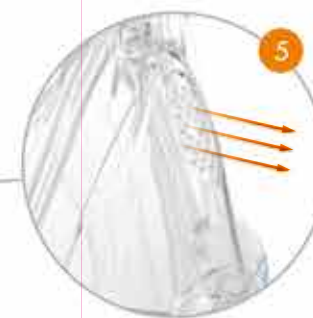
Sfiato laminare del flusso d'aria

6 La maschera è costituita solo da 2 parti che ne facilitano lo smontaggio ed il rimontaggio e ne semplificano la pulizia.