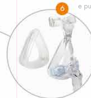
Smontaggio e pulizia

Respireo Primo F è una maschera facciale monopaziente confortevole e adattabile. La facilità di applicazione è motivo di tranquillità e di confort per coloro che la indossano.